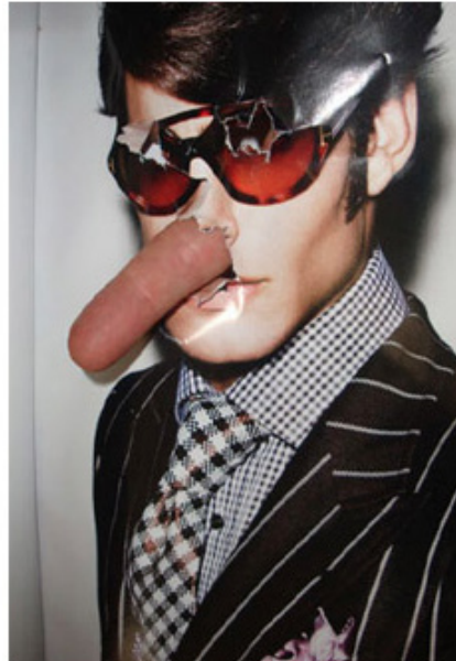
Beni Bischof META-FINGERS , 2009 30 x 42 cm, impression jet d'encre